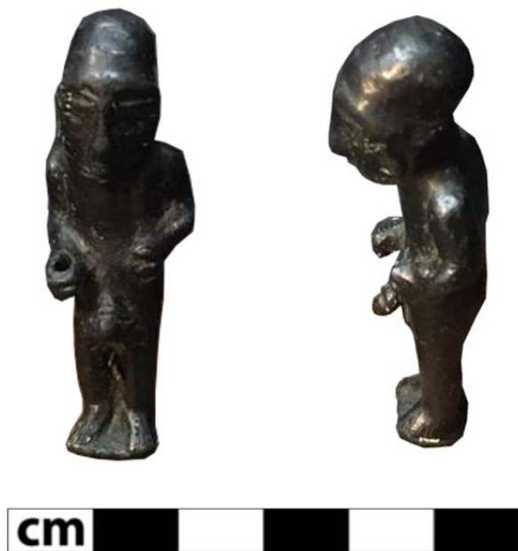
Figura 2. Vista frontal y lateral del exvoto alóctono en bronce de guerrero u oferente, descubierto de manera casual a mediados de los años 30 en el entorno de Coimbra del Barranco Ancho.

A finales de agosto de 1993, Francisco Gil González reporta la aparición de un pequeño depósito arqueológico en la ladera Este del santuario, mismo lugar en el que aparecieron los fragmentos de pebeteros. Este hallazgo conllevó el desarrollo de una intervención de urgencia en la que se excavó lo que resultó ser el fondo de una favissa que aún albergaba materiales votivos. Entre las ofrendas rescatadas destacan: platos decorados, terracotas femeninas y