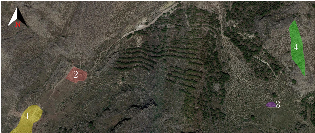
Figura 1. Localización geográfica del conjunto ibérico de Coimbra del Barranco Ancho. 1. Poblado. 2. Necrópolis del Poblado. 3. Necrópolis de la Senda. 4. Santuario.