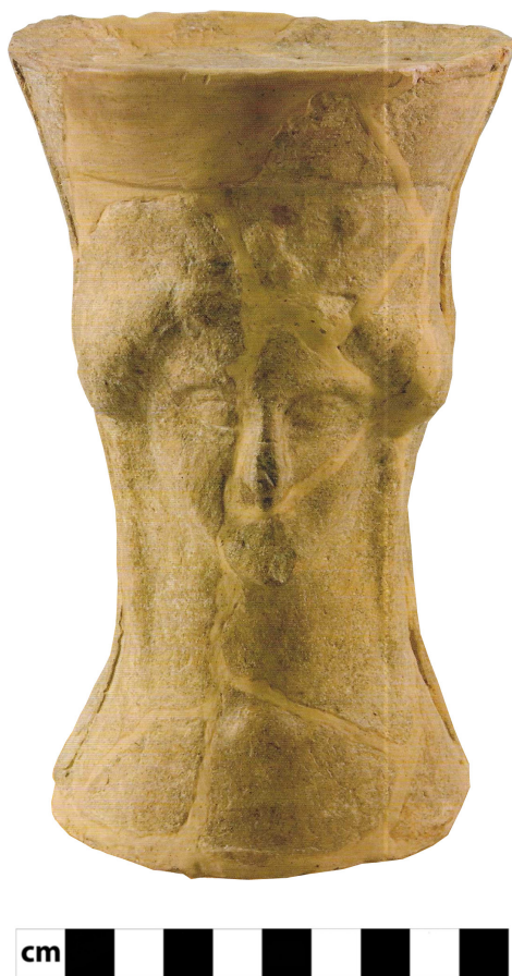
Figura 4. Pebetero de cabeza femenina tipo Deméter procedente del santuario de Coimbra del Barranco Ancho.

es imposible apuntar a ciencia cierta si estas terracotas con la representación de la divinidad a la que se ofrecen como exvoto o si por el contrario son la imagen de los propios oferentes 26 . En cualquier caso, la presencia de estos objetos vinculados con la representación de una diosa madre de tipo Deméter ha llevado a proponer un culto a la naturaleza y más concretamente de un carácter agrario para este santuario, así como un culto de protección de la humanidad y del vínculo del matrimonio 27 . Así pues, todos los ritos asociados a esta estación giran en torno a la búsqueda de la fecundidad y de la protección, tanto humana como de la tierra.