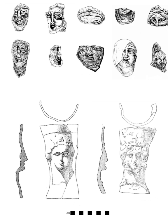
Figura 3. Conjunto de terracotas y pebeteros recuperados del santuario de Coimbra del Barranco Ancho.

Destaca principalmente el amplio número de fragmentos y piezas completas de terracotas de cabezas femeninas ampliamente analizadas en las publicaciones sobre el santuario, llegando incluso a realizarse una tipología sobre ellas 20 (Figs. 3 y 4). La aparición de estos pebeteros como ofrenda en espacios rituales ibéricos es un fenómeno común y muy bien estudiado en el sudeste peninsular 21 . En el caso de Coimbra del