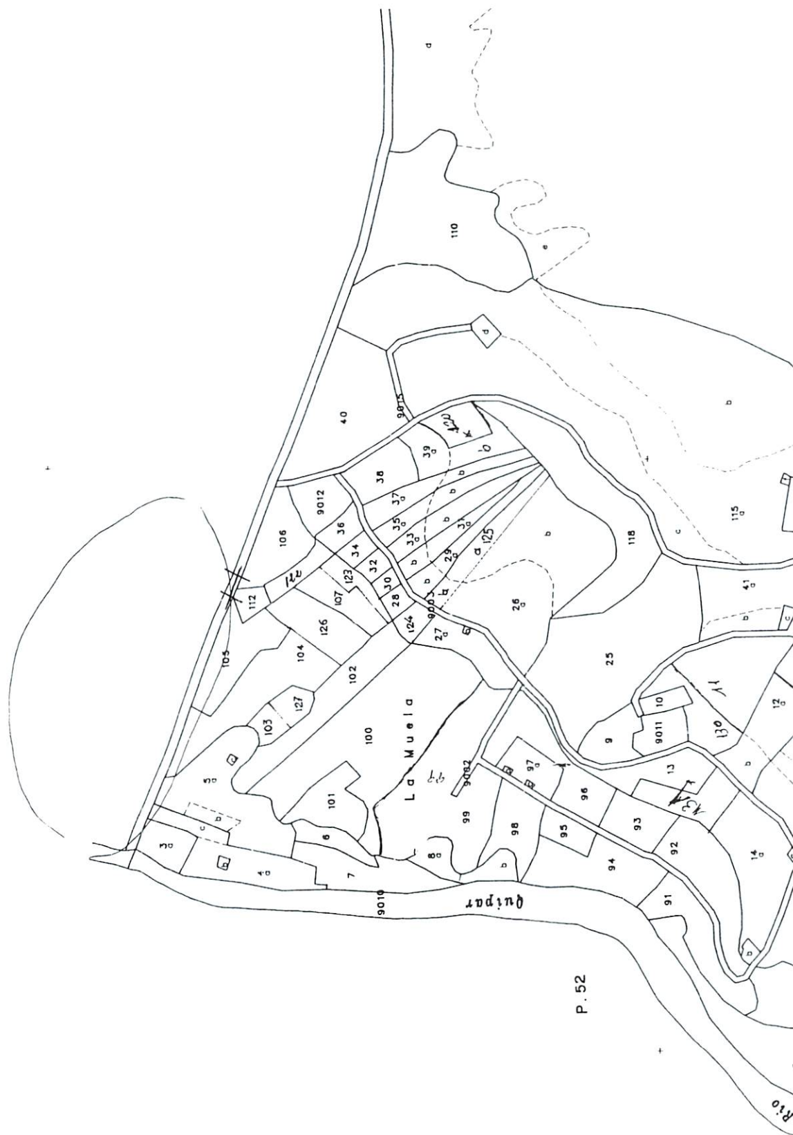
Lámina 3: Plano catastral de la zona de los túneles con indicación de las fincas en las que los localizamos.