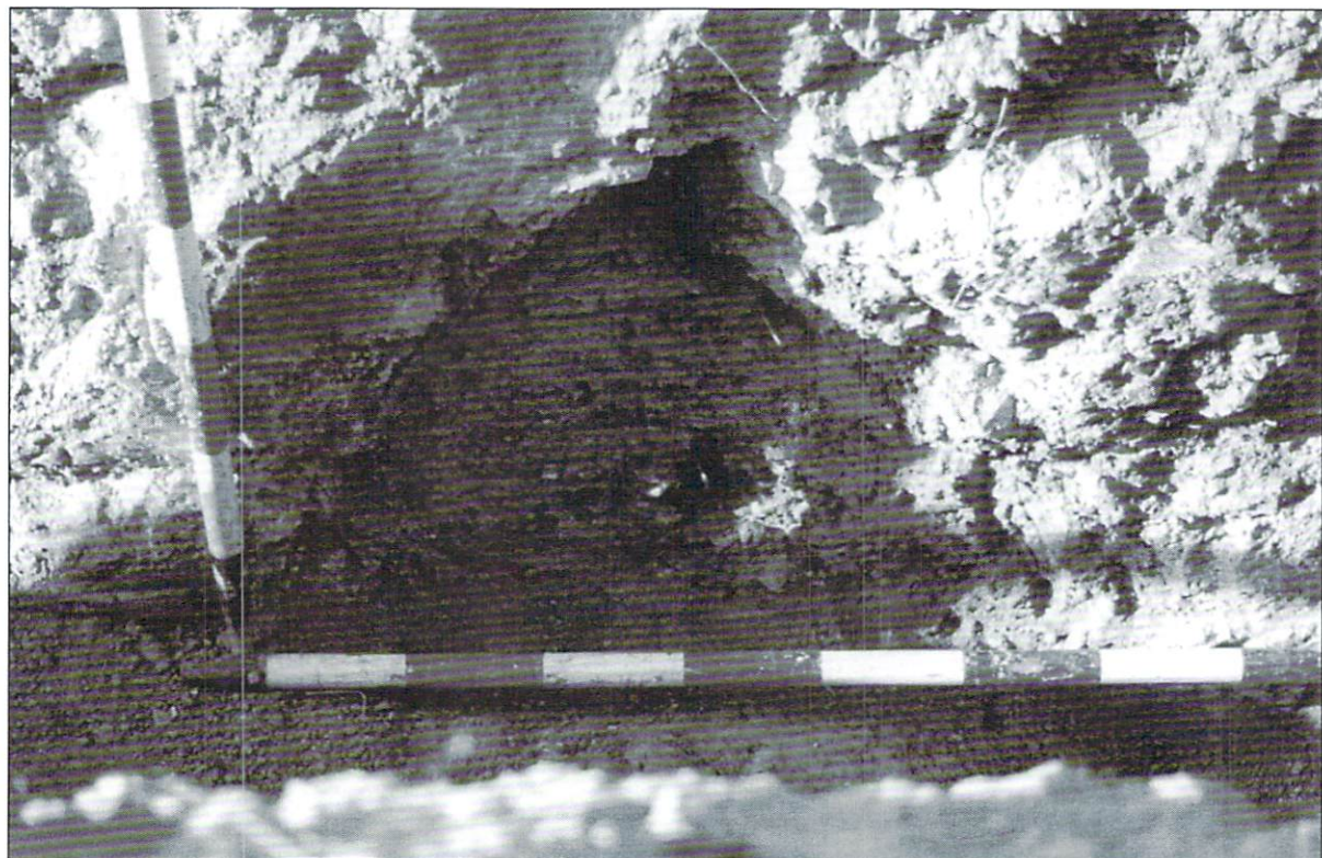
Lámina 5: Vista del túnel occidental y del corte del túnel oriental.