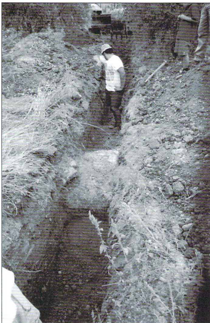
Lámina 4: Vista del tunel occidental cuando comenzó a aparecer.